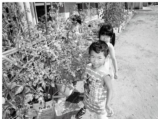
肥料袋を使つてのミニトマトの栽培