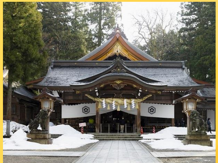
白山と白山比咩神社