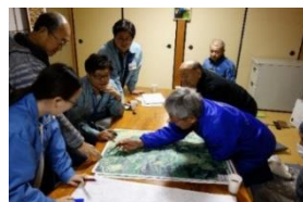
防災マップ作成状況（金沢市）