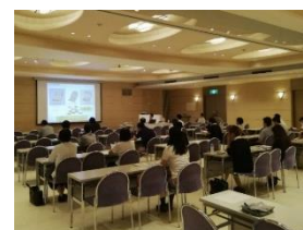
ケアマネジャーへの土砂災害に関する説明の様子

県市町 要配慮者利用施設に対する避難確保計画ガイドライン・避難訓練シナリオの作成・配布