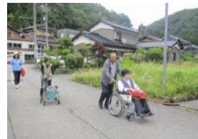
避難訓練実施状況（小松市）