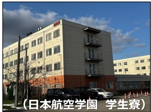
（日本航空学園 学生寮） 学生の県外避難により、空室になった部屋を個室として活用