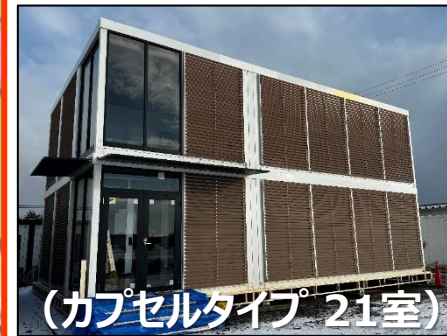
（カプセルタイプ 21室）