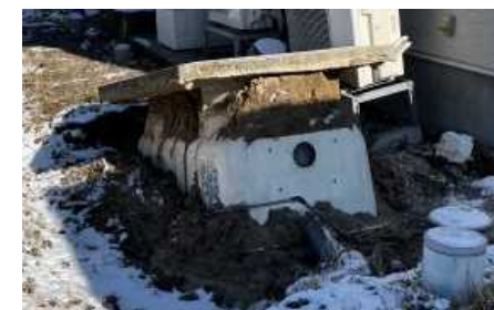
地震により浮き上がった浄化槽 (画像は七尾市内の例)