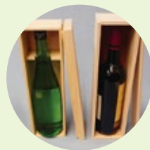
木箱・小箱 (スギ・能登ヒバ)