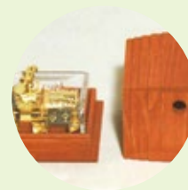
オルゴール(能登ヒバ)