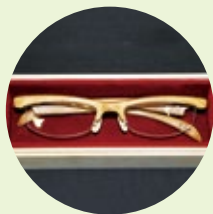
メガネフレーム (能登ヒバ)