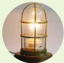
電気スタンド(ケヤキ)