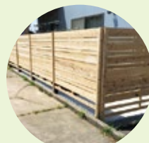
フェンス (スギ・能登ヒバ)