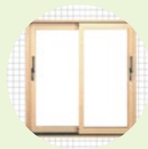
サッシフレーム (能登ヒバ)