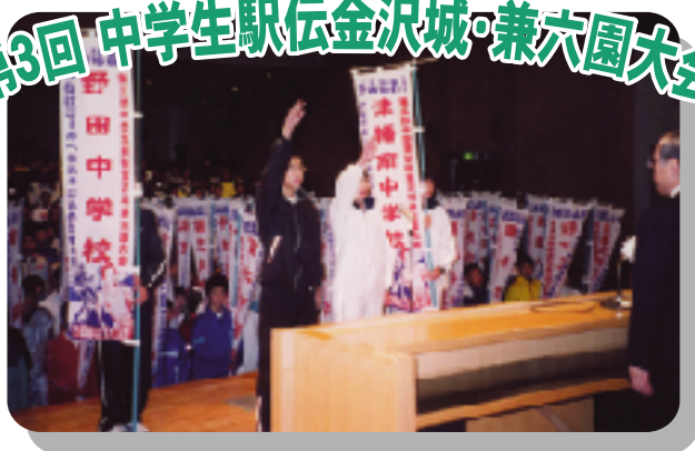
開会式での選手宣誓