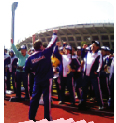
結団壮行式での ガンバロウ! (丸亀競技場)