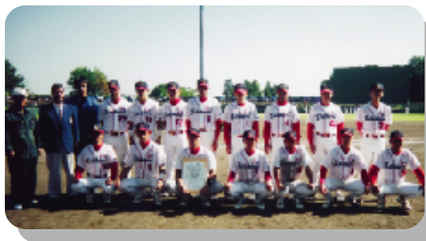
準優勝した成年男子軟式野球チームの皆さん