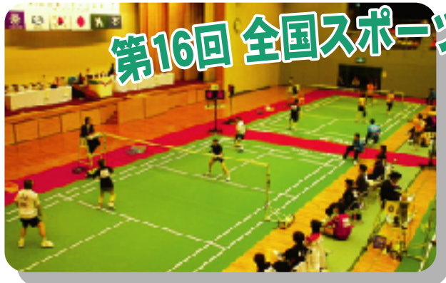
年齢別バドミントン