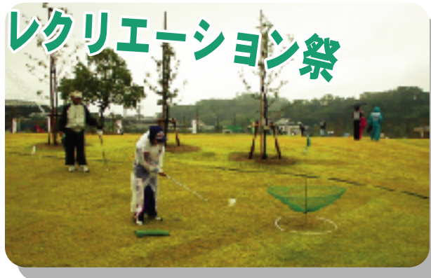
ターゲットバードゴルフ