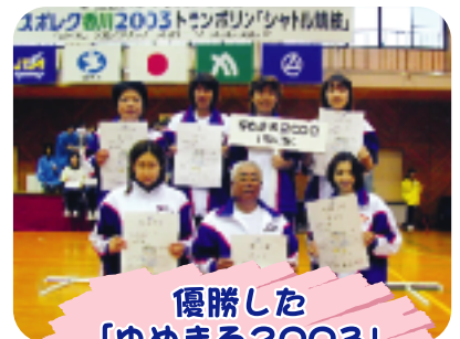
優勝した 「ゆめまる2003」 の皆さん(トランポリン)