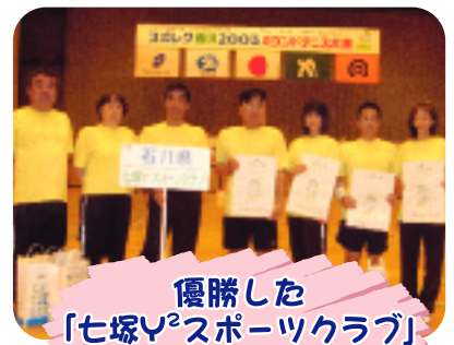
優勝した 「七塚Y 2 スポーツクラブ」 の皆さん(バウンドテニス)