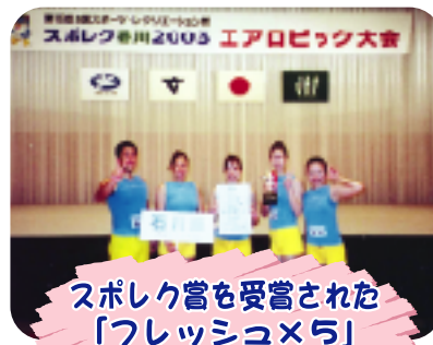
スポレク賞を受賞された 「フレッシュ×5」 の皆さん(エアロビック)