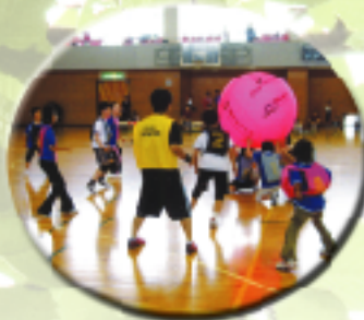
キンボール交流大会