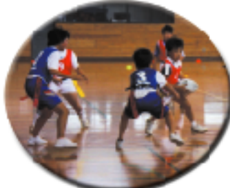
タグラグビー大会