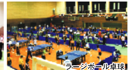
ラージボール卓球