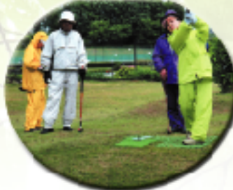
グラウンド・ゴルフ大会