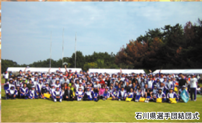
石川県選手団結団式

「スポレクみやざき2009」は、美しい日向灘と緑あふれる山々を擁する豊かな自然に恵まれた宮崎県内15市町において、18種目の大会が開催され、石川県からは155名の選手・監督が参加しました。