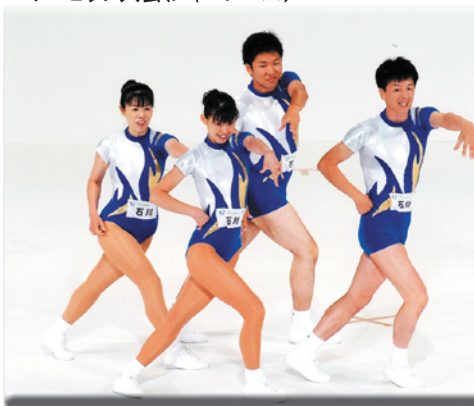
第22回全国スポーツ・レクリエーション祭 エアロビック大会(ジャージーズ)