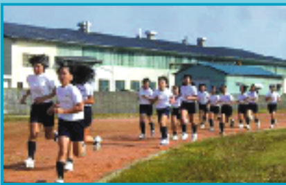
校内マラソン大会