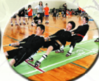
男女混合綱引大会