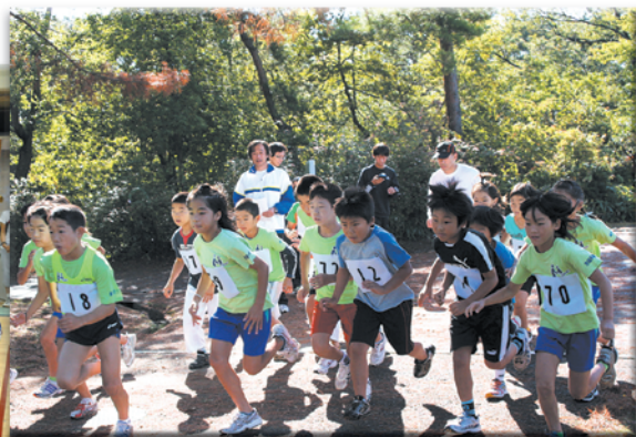
第18回石川県民スポーツ・レクリエーション祭 モア祭りロードレース