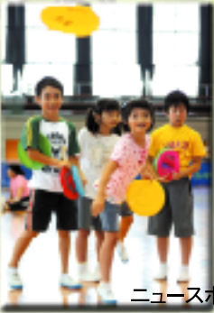
ニュースポーツ体験広場 (羽咋市)