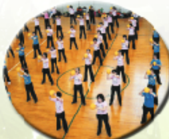
3B体操石川のつどい