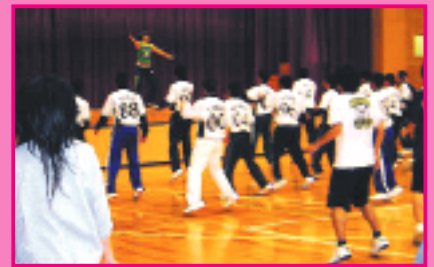
エアロビクストレーニング