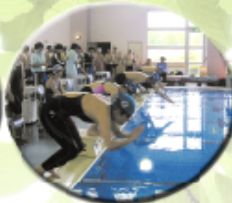
スイミングフェスタ大会