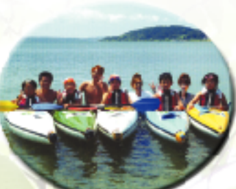
マリンスポーツを楽しもう NASPO(ナスポ)