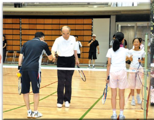
第18回石川県民スポーツ・レクリエーション祭 フレッシュテニス交流大会