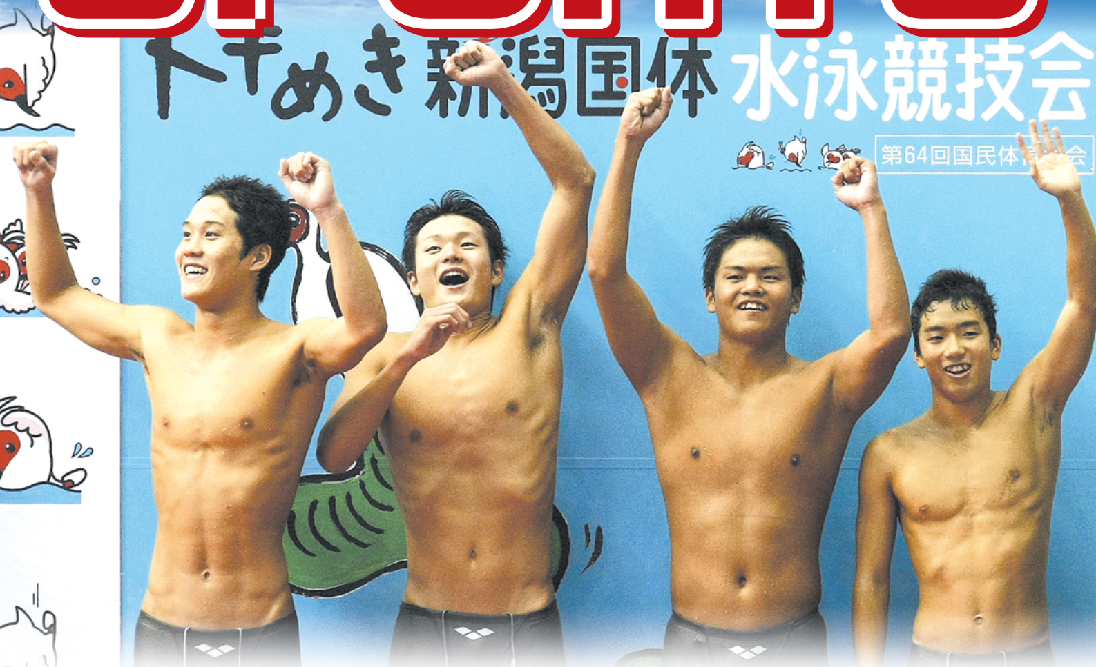
第64回国民体育大会 競泳少年男子B400Mリレー優勝