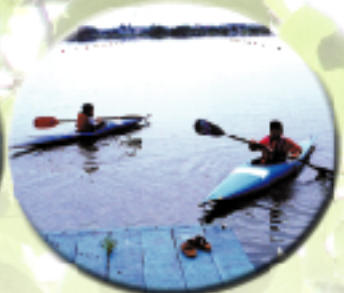
ふれあいカヌー大会