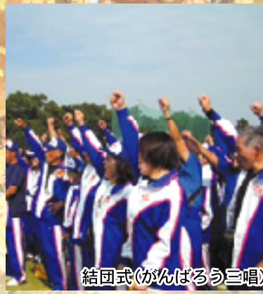
結団式(がんばるう三唱)