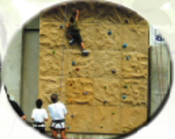
クライミング大会