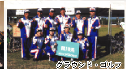
グラウンド・ゴルフ