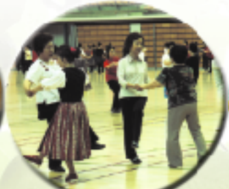
中高年フォークダンスフェスティバル