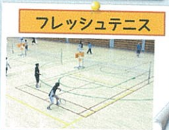
フレッシュテニス