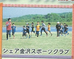
シェア金沢スポーツクラブ