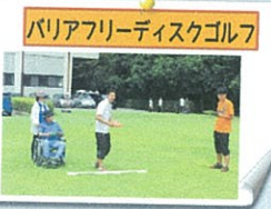
パリアフリーディスクゴルフ