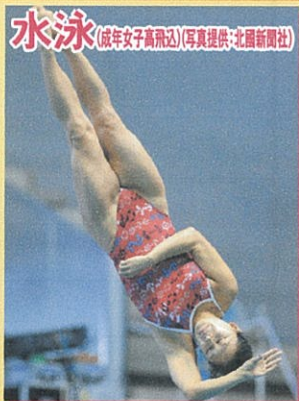
水泳(成年女子高飛込)