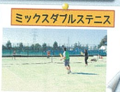
ミックスダブルステニス