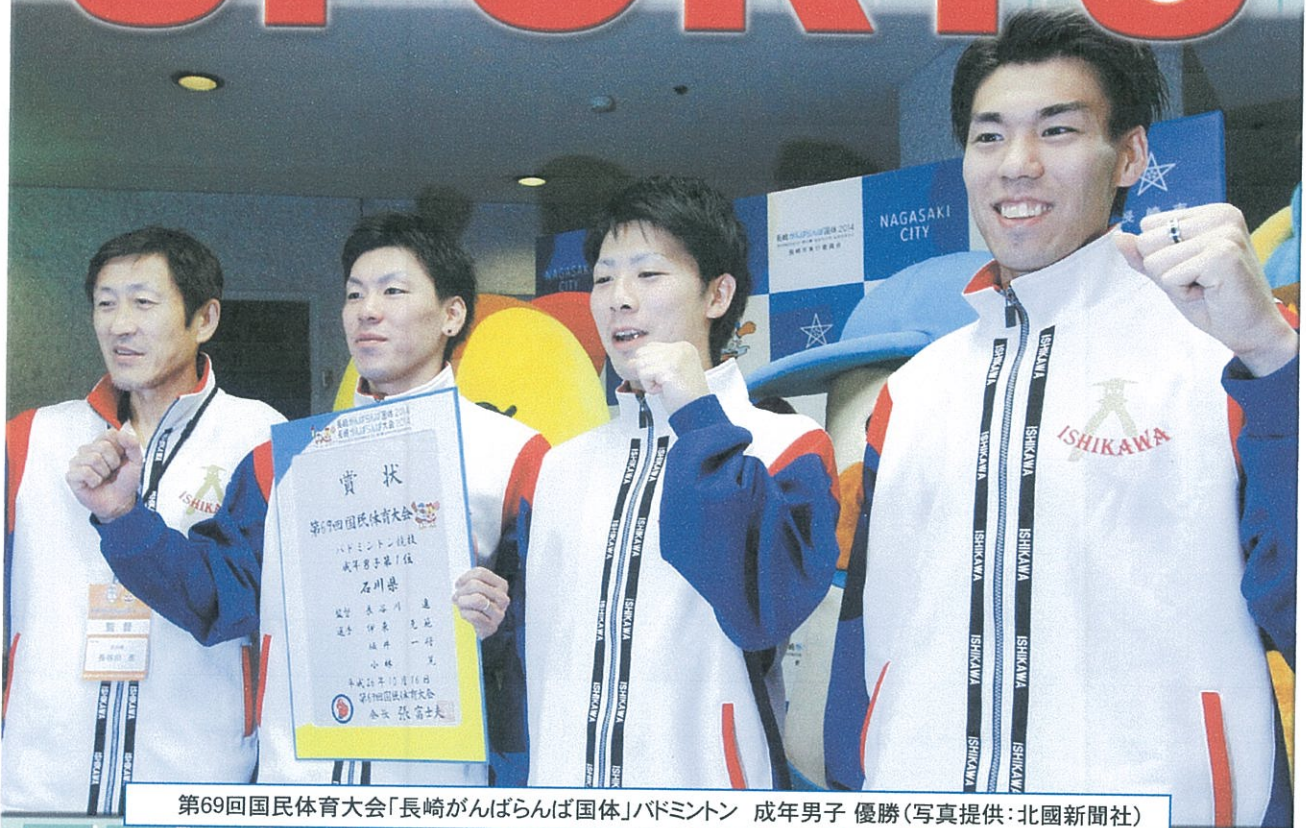
第69回国民体育大会「長崎がんばらんば国体」バドミントン 成年男子 優勝