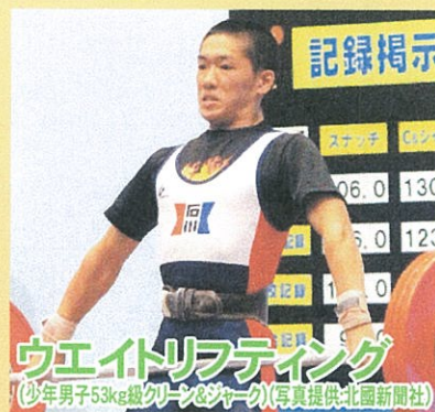
ウエイトリフティング(少年男子53kg級クリーン&ジャーク)