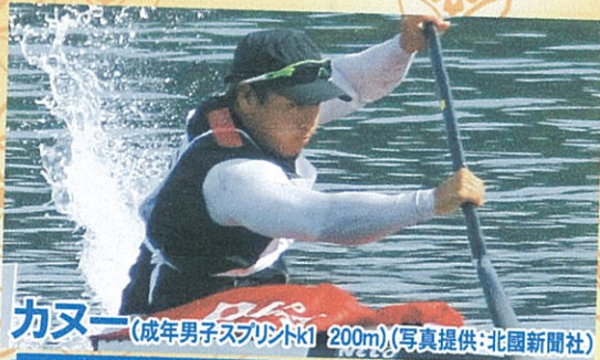
カヌー (成年男子スプリントK1 200m)