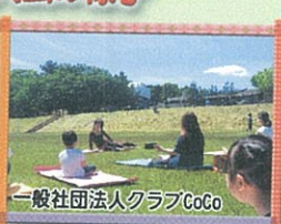
一般社団法人クラブCoCo