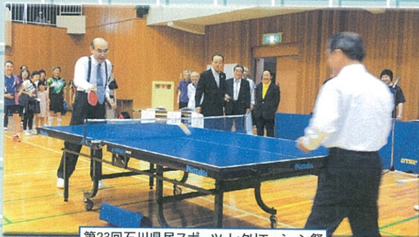
第23回石川県民スポーツ・レクリエーション祭 「ラージボール卓球大会」