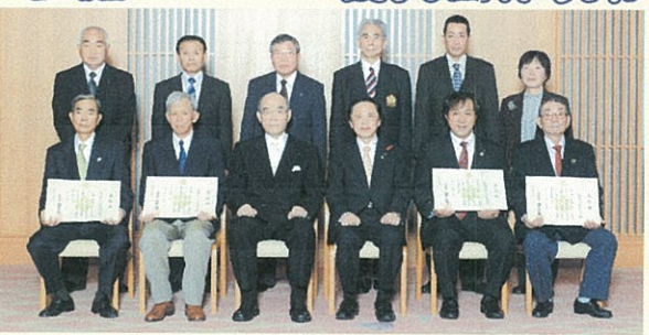
生涯スポーツ優良団体(10団体)