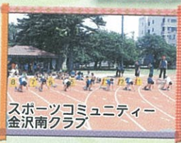
スポーツコミュニティ 金沢南クラブ