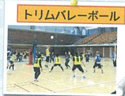
トリムバレーボール