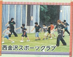
西金沢スポーツクラブ