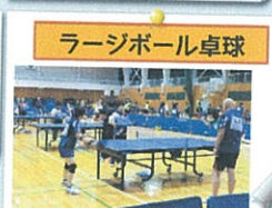
ラージボール卓球