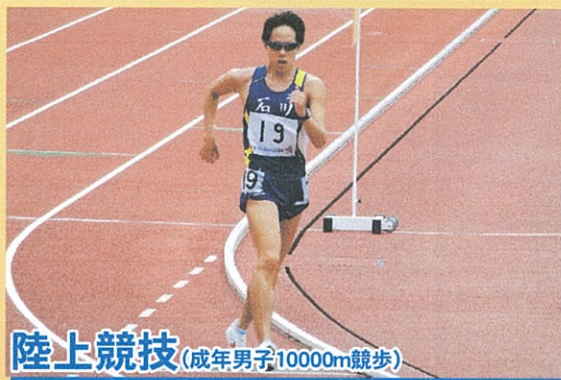
陸上競技(成年男子10000m競歩)