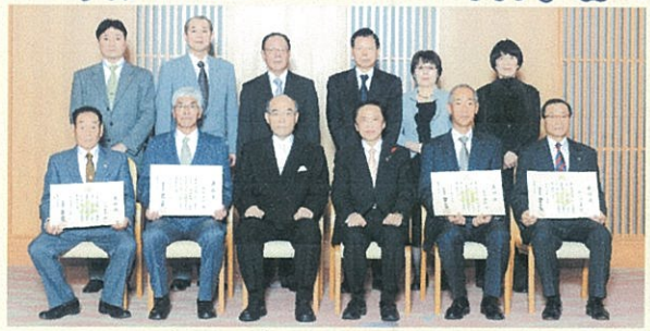
生涯スポーツ功労者(10名)