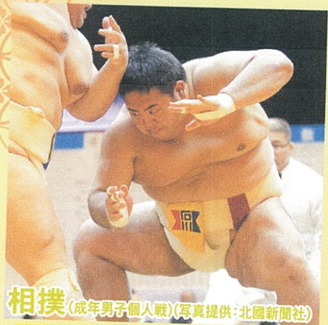
相撲 (成年男子個人戦)