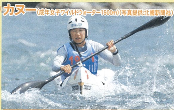
カヌー(成年女子ワイルドウォーター1500m)