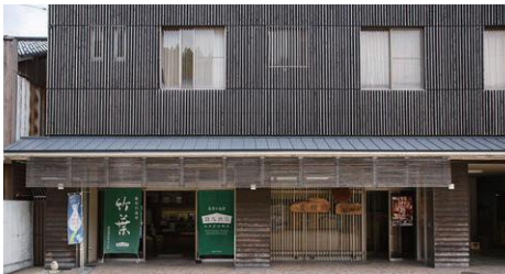
趣が感じられる社屋外観