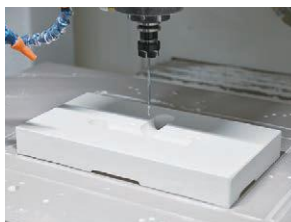
3Dプリンタによる型製作