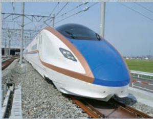
北陸新幹線新型車両N700系