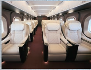
グランクラス客室

首都圏と北陸新幹線沿線をつ結び、日本の伝統文化と未来をつなぐという意味から、「和」の未来を新型車両のデザインコンセプトとしています。新型車両は12両編成で、プレミアムブランドである「グランクラス」を導入しました。大人の琴線に触れる「洗練さ」と、心と体の「ゆとり・開放感」で、新たな鉄道の旅を提供します。