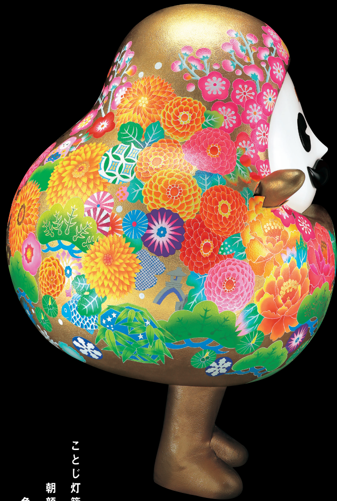
朝顔 魚 ことじ灯籠