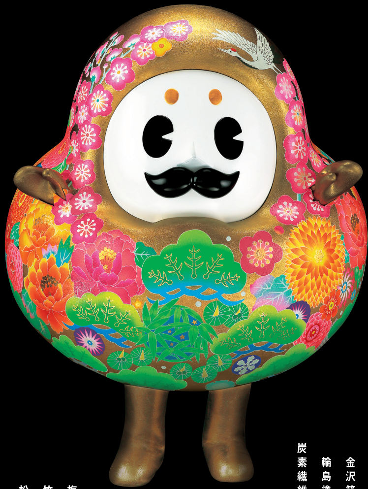
松 竹 梅