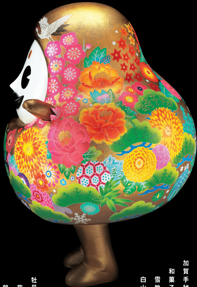
牡丹 菊 鶴