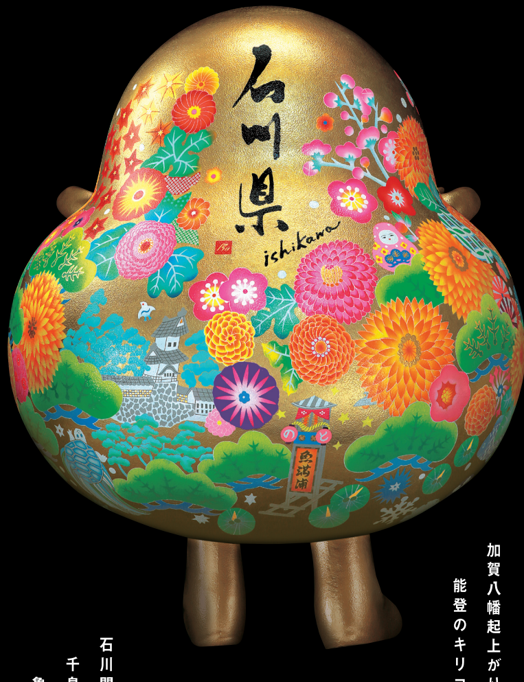
石川門 千鳥 亀