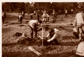
企業やボランティア団体による森づくり活動