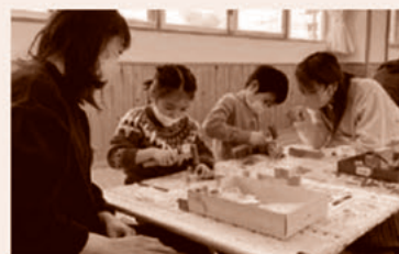
木の良さを伝える木育出前講座