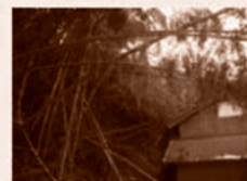
人家裏の放置竹林