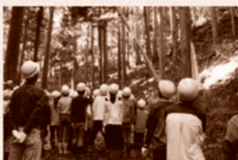
子ども達を対象とした森林環境教育

森林や木材利用に対する県民の皆さまの理解の増進と、県民参加の森づくりの推進を図るため、子ども達を対象とした森林環境教育やボランティア団体等が行う森づくり活動への支援、木育に関する出前講座の開催などに取組みます。